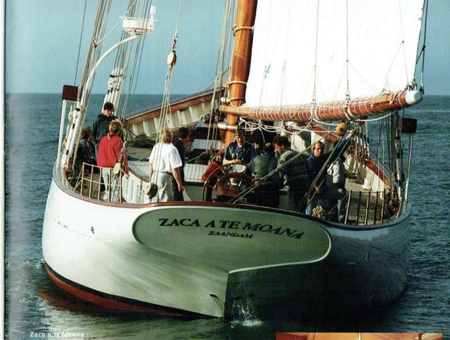
Zaca a te Moana

kits tuigage ontworpen. Het dekhuis is zo vormgegeven dat een riante 'deksalon' met een prachtig uitzicht rondom kon worden gerealiseerd.