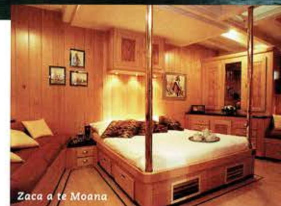
Zaca a te Moana

Een grote vide zorgt voor een charmante overgang naar de salon en de kombuis benedendeks. Samen met de fraai vormgegeven kuip hebben alle plekken een geraffineerd contact met elkaar. Er ontstaat op deze wijze een geweldig leefbaar schip, zowel boven- als onderdeks. Diverse interi-