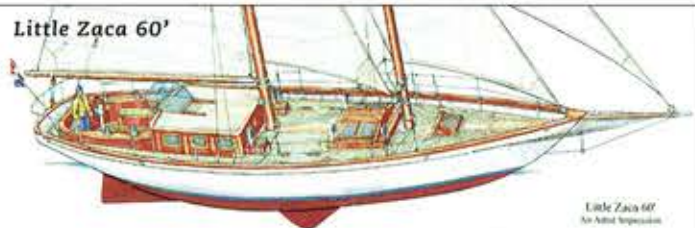
Little Zaca 60'

Aldus kan zij zonodig door twee personen worden gezeild. Het harmonische zeilplan met precies de goede verhoudingen, helling van de masten etcetera, zorgt ervoor dat de echte schoener uitstraling behouden blijft. Overigens wordt er voor de liefhebbers ook een uitvoering met een